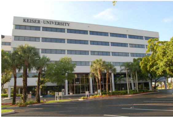
凯瑟大学主校区 - 佛罗里达罗德岱堡