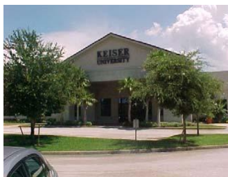
Keiser University, Campus de Daytona Beach

El Campus principal de la Universidad de Keiser se encuentra en 2600 Norte Military Trail en West Palm Beach, en 100 acres con 263,968 pies cuadrados de edificios. El recinto principal ofrece a los estudiantes residencia con los planes de comidas, seguridad las 24 horas, Wi - Fi y acceso a televisión por cable, y mantiene instalaciones para apoyar a 17 equipos deportivos NAIA, clubes deportivos y actividades intramurales. Todo el equipamiento utilizado en la Universidad de Keiser cumple con los estándares de la industria y los requisitos del programa.