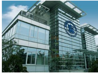
Keiser University, Shanghai, China

El sitio off-campus de Shanghai se encuentra en el distrito financiero de Xujiahu, Shanghai, en la República Popular de China. El campus cuenta con más de 55,000 pies cuadrados de aulas, oficinas y salas de reuniones y conferencias. Cuenta además con una biblioteca, sala de estudiantes y una red inalámbrica de ordenadores. Existe un sistema de servicio de parking de pago alrededor del campus. La ciudad de Shanghai también tiene un excelente sistema de transporte público, con fácil acceso a los edificios del campus. Todo el equipo es comparable a los estándares de la industria y cumple efectivamente los objetivos del programa.