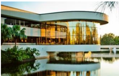
Keiser University, Sede Flagship

El sitio off-campus de Shanghai se encuentra en el distrito financiero de Xujiahu, Shanghai, en la República Popular de China. El campus cuenta con más de 55,000 pies cuadrados de aulas, oficinas y salas de reuniones y conferencias. Cuenta además con una biblioteca, sala de estudiantes y una red inalámbrica de ordenadores. Existe un sistema de servicio de parking de pago alrededor del campus. La ciudad de Shanghai también tiene un excelente sistema de transporte público, con fácil acceso a los edificios del campus. Todo el equipo es comparable a los estándares de la industria y cumple efectivamente los objetivos del programa.