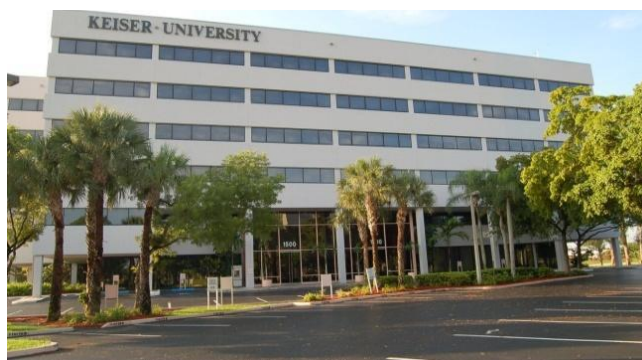
Campus principal Keiser University – Ft. Lauderdale, FL