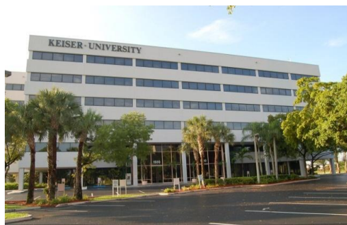
Campus principal Keiser University – Ft. Lauderdale, FL