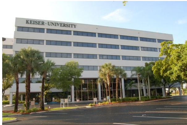
Keiser University, campus de Fort Lauderdale

El campus principal de Keiser University está ubicado en el distrito residencial de Fort Lauderdale, aproximadamente a una milla al oeste de la carretera interestatal I-95. El edificio de la universidad fue diseñado tomando en consideración las necesidades específicas de los programas de Keiser University. El edificio abarca más de 100,000 pies cuadrados de laboratorios, aulas y oficinas climatizadas y bien iluminadas. La universidad cuenta con una biblioteca, una sala de estar para los estudiantes y un centro de computación. Keiser University cuenta con un amplio estacionamiento gratuito y se encuentra ubicada dentro de una importante ruta de autobuses. Todo el equipo utilizado en Keiser University es equiparable con los estándares de la industria y cumple con los objetivos del programa de manera efectiva.