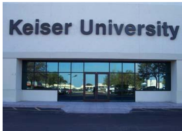
Keiser University, Melbourne

El campus de Lakeland se encuentra en el parque empresarial de la carretera interestatal 31 en la salida de la Interestatal 4. Las dos instalaciones (compuesto por un edificio de 42,000 pies cuadrados y un edificio de 26,000 pies cuadrados) contienen 31 aulas de clases, 15 laboratorios relacionados con la salud, dos laboratorios de ciencias naturales, seis laboratorios de computación y un laboratorio de dietética. Cuenta con una biblioteca estudiantil, múltiples zonas comunes para los estudiantes, un auditorio y estacionamiento adyacente gratuito. Todo el material utilizado en la Universidad de Keiser es comparable a los estándares de la industria y cumple efectivamente los objetivos del programa.