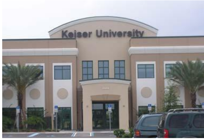
Keiser University, Campus de Lakeland

El campus de Lakeland se encuentra en el parque empresarial de la carretera interestatal 31 en la salida de la Interestatal 4. Las dos instalaciones (compuesto por un edificio de 42,000 pies cuadrados y un edificio de 26,000 pies cuadrados) contienen 31 aulas de clases, 15 laboratorios relacionados con la salud, dos laboratorios de ciencias naturales, seis laboratorios de computación y un laboratorio de dietética. Cuenta con una biblioteca estudiantil, múltiples zonas comunes para los estudiantes, un auditorio y estacionamiento adyacente gratuito. Todo el material utilizado en la Universidad de Keiser es comparable a los estándares de la industria y cumple efectivamente los objetivos del programa.