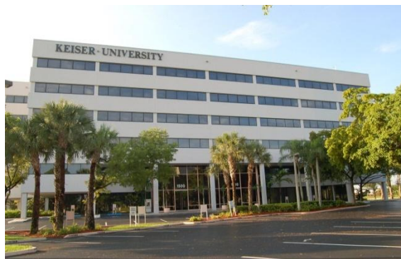
Campus principal Keiser University – Ft. Lauderdale, FL