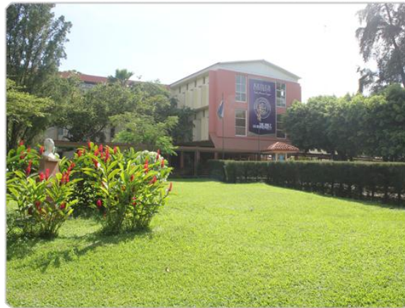
Keiser University, San Marcos, Nicaragua (sede off-campus)

El campus principal de Keiser University está ubicado en el distrito residencial de Fort Lauderdale, aproximadamente a una milla al oeste de la carretera interestatal I-95. El edificio de la universidad fue diseñado tomando en consideración las necesidades específicas de los programas de Keiser University. El edificio abarca más de 100,000 pies cuadrados de laboratorios, aulas y oficinas climatizadas y bien iluminadas. La universidad cuenta con una biblioteca, una sala de estar para los estudiantes y un centro de computación. Keiser University cuenta con un amplio estacionamiento gratuito y se encuentra ubicada dentro de una importante ruta de autobuses. Todo el equipo utilizado en Keiser University es equiparable con los estándares de la industria y cumple con los objetivos del programa de manera efectiva.