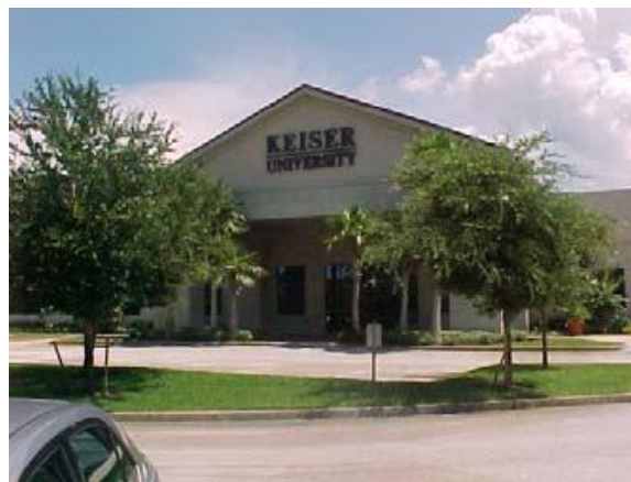
Keiser University, Campus de Daytona Beach

El sitio off-campus de Shanghai se encuentra en el distrito financiero de Xujiahu, Shanghai, en la República Popular de China. El campus cuenta con más de 55,000 pies cuadrados de aulas, oficinas y salas de reuniones y conferencias. Cuenta además con una biblioteca, sala de estudiantes y una red inalámbrica de ordenadores. Existe un sistema de servicio de parking de pago alrededor del campus. La ciudad de Shanghai también tiene un excelente sistema de transporte público, con fácil acceso a los edificios del campus. Todo el equipo es comparable a los estándares de la industria y cumple efectivamente los objetivos del programa.