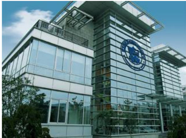
Keiser University, Shanghai, China (sede off-campus)

la Universidad de Keiser es comparable a los estándares del sector y cumple efectivamente con los objetivos del programa.